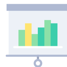
Cámaras y Asociaciones