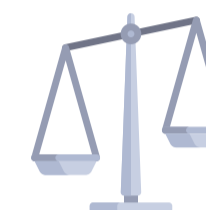
Abogados y Cabilderos

Nuestros servicios son utilizados con éxito por los más variados profesionales en distintas industrias.