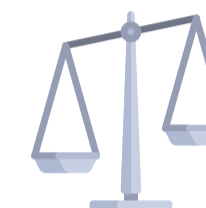
Abogados y Cabilderos

Nuestros servicios son utilizados con éxito por los más variados profesionales en distintas industrias.